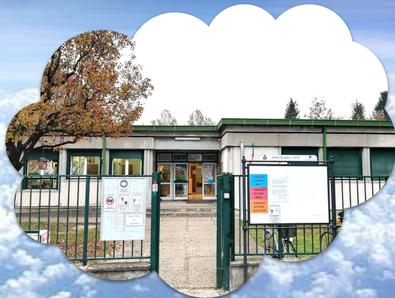
COLLODI Via Martiri di Via Fani