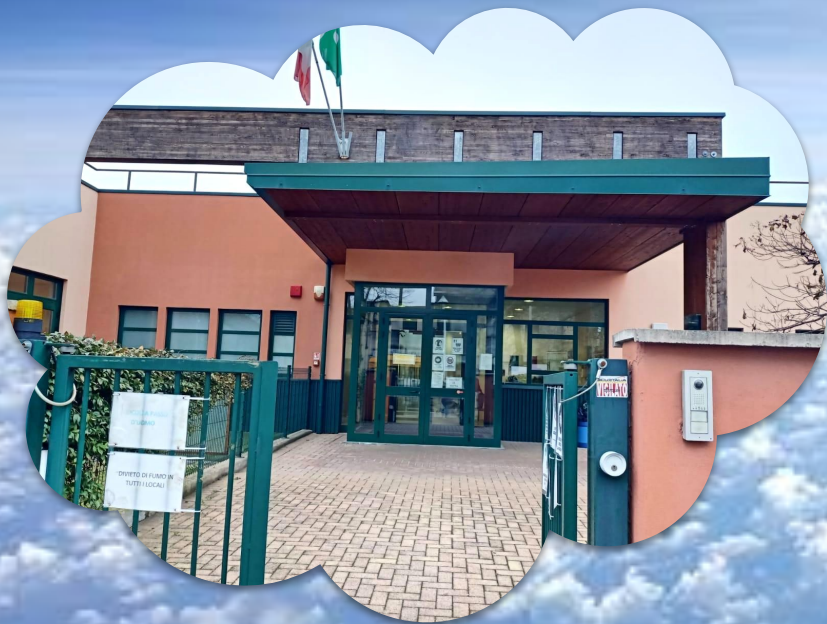
MONTESORI Via Verdi